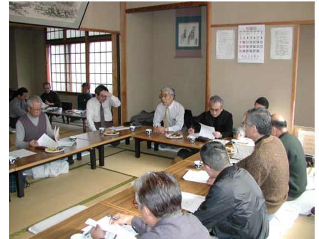
第1回情報交換会（'03.2.9 久里浜公民館）