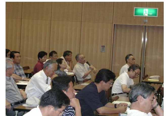
マンションセミナー（'02.7.27 ヴェルク）